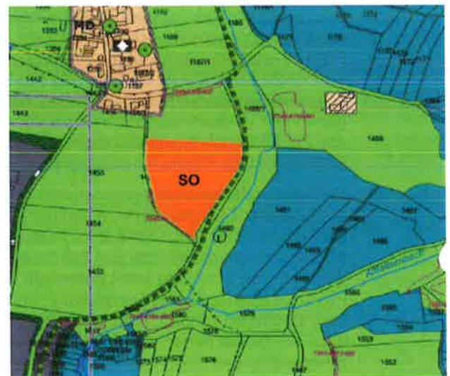
Abbildung 2: Ausschnitt aus dem Flächennutzungsplan Deckblatt 28 der Gemeinde Thurmansbang

Arten- und Biotopschutzprogramm für den Landkreis Freyung-Grafenau (räumlich zugeordnete Ziele des Kartenteils):