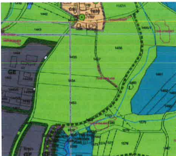
Abbildung 1: Ausschnitt aus dem rechtskräftigen Flächennutzungsplan der Gemeinde Thurmansbang

Der Flächennutzungsplan stellt den geplanten Modulbereich als Fläche für die Landwirtschaft dar. Der Flächennutzungsplan wird durch Deckblatt Nr. 28 geändert.